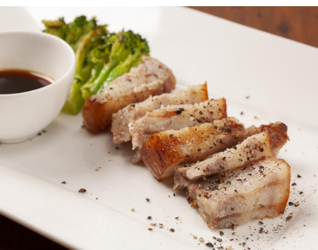
南津軽昔豚のステーキ