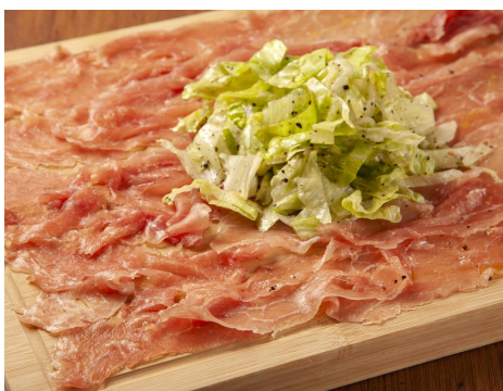
名物！生ハム広場～大地～