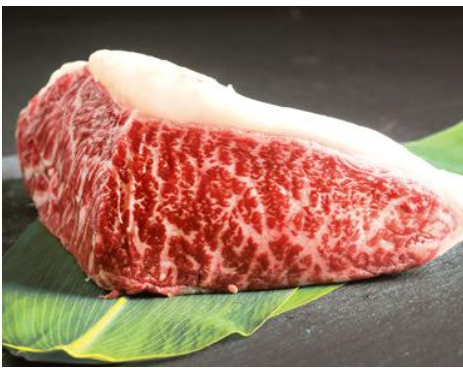
A4黒火乃牛の特上ももステーキ