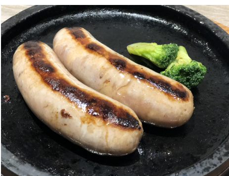
リングイッサシュラスコの生フランク