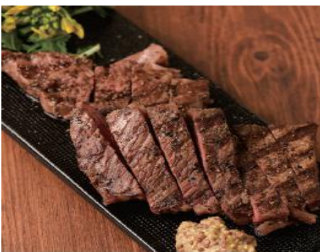
アンガス牛肩ロースステーキ